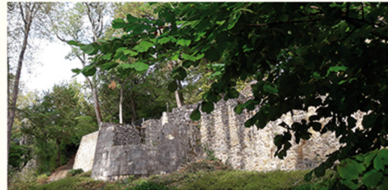
Tour de la chapelle

Aménagé au début du XIXe siècle sur les ruines remblayées de l'ancienne forteresse princière, le parc, traité à l'anglaise, est ouvert au public dès 1849.